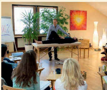
Seminar im Licht-Gesundheit-Energie Zentrum

FreiZeitSchrift: Herr Wienert, was dürfen wir uns unter Matrix in Balance vorstellen? Wie ist es aufgebaut?